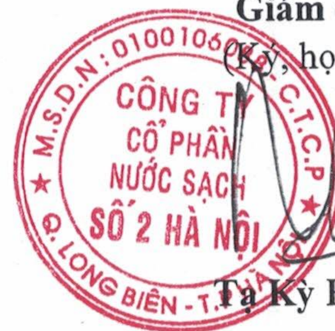
Tạ Kỳ Hưng